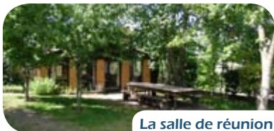
La salle de réunion