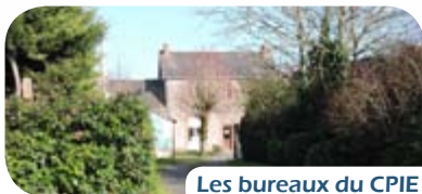
Les bureaux du CPIE

Le CPIE est implanté à Corcoué sur Logne. Son territoire d'intervention est déterminé par le bassin versant de Grand-Lieu et la communauté de communes Sud Retz Atlantique. Le CPIE peut être amené à travailler sur un territoire plus large, selon les projets.