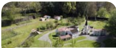
La Maison de l'Eau et des Paysages