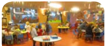
Accueil périscolaire de Corcoué sur Logne