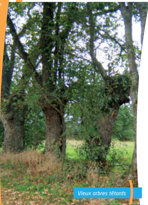
Vieux arbres têtards

La Réserve naturelle régionale « Bocage humide des Cailleries » est située sur la commune de Saint-Colomban (44), au sud de la Loire-Atlantique et en limite de la Vendée.